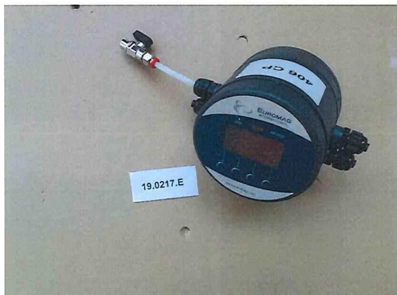
Figura 5 | Figure 5