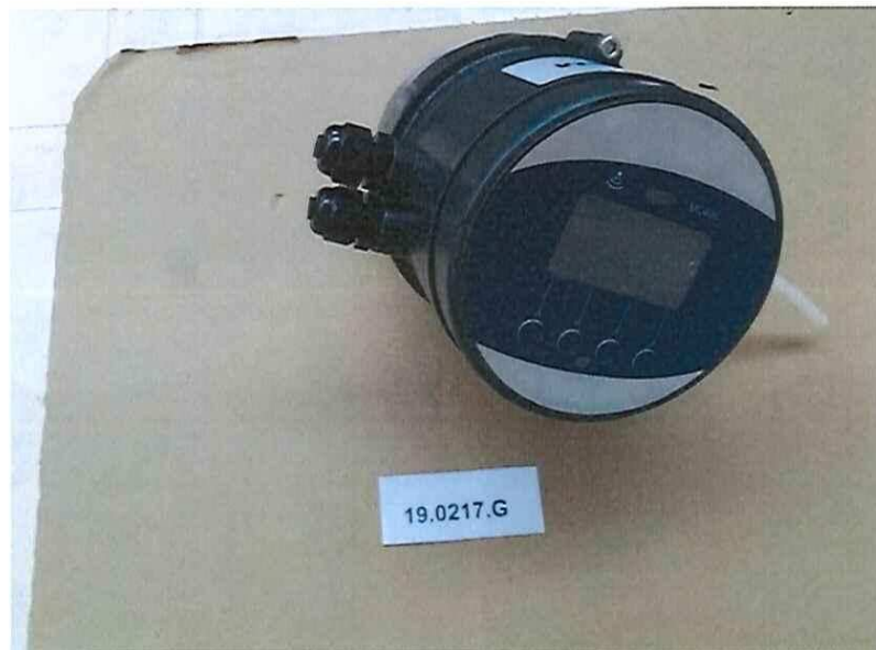
Figura 5 | Figure 5