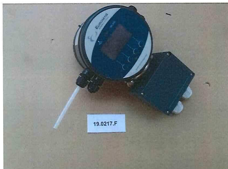
Figura 5 | Figure 5