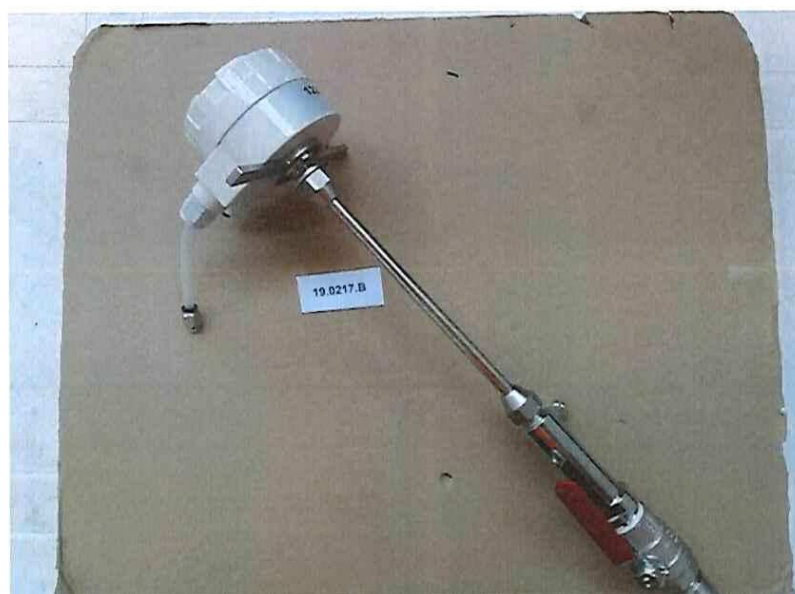
Figura 5 | Figure 5