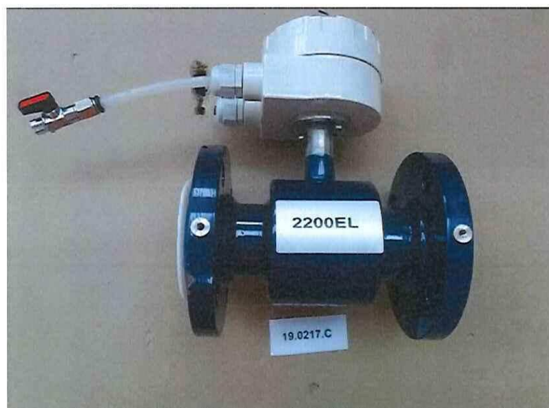
Figura 5 | Figure 5