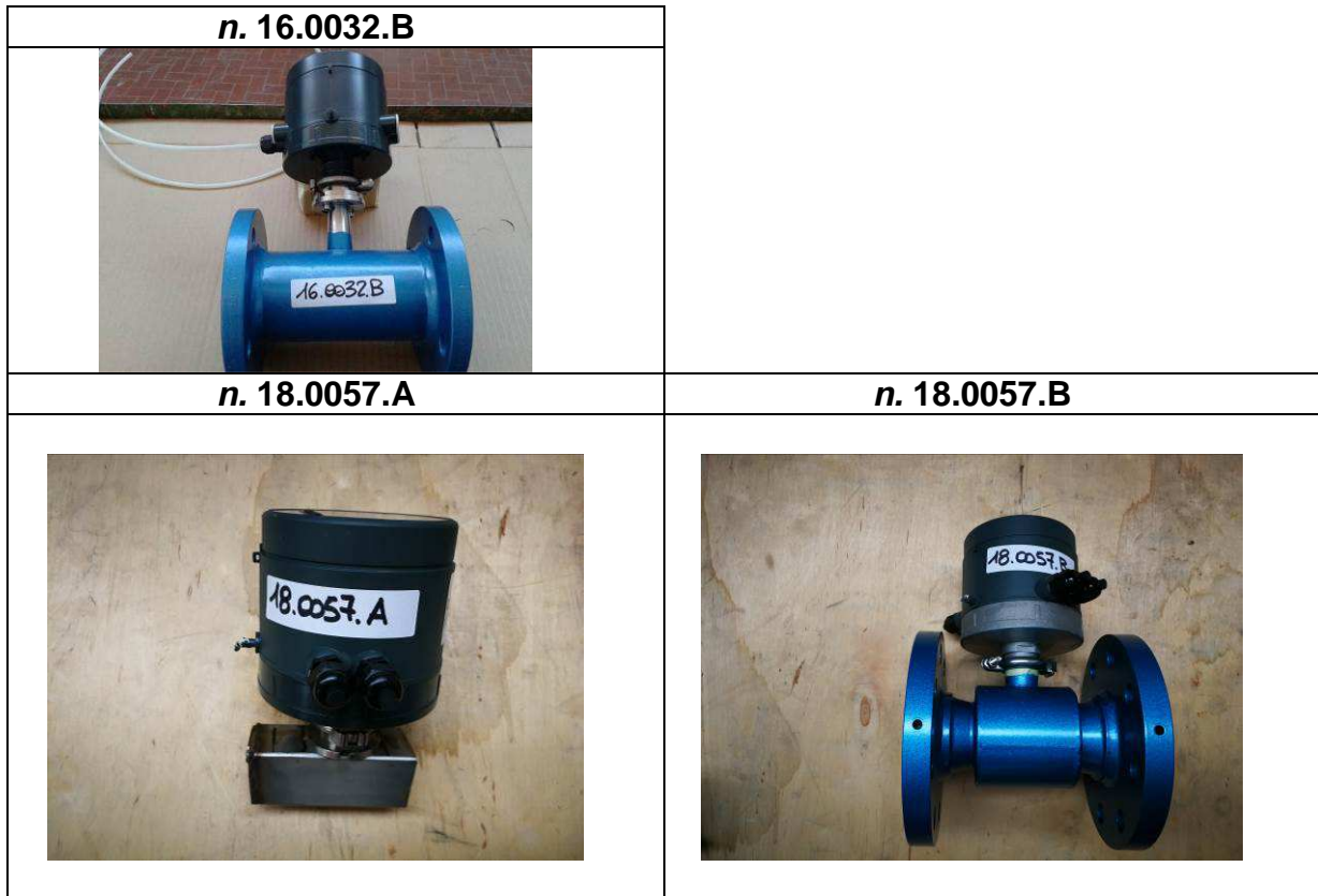
Figura 4 / Figure 4